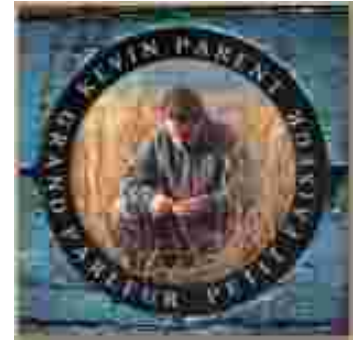
Album: Grand parleur, Petit faiseur (1998)